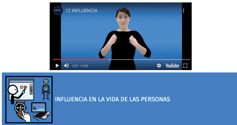
Fig.1 Encapçalament d'un dels apartats del qüestionari dissenyat per a QuestionPro. En el llenguatge de signes va col·laborar la Federació de Persones Sordes de la Comunitat Valenciana (FESORD CV) i en el de lectura fàcil i Plena Inclusió Comunitat Valenciana

A més, el qüestionari va incloure un enregistrament en llenguatge de signes de cada pregunta, per a adaptar-lo i ser completat sense problemes per persones amb discapacitat auditiva, i es traslladà completament a lectura fàcil, per a aquells amb discapacitat intel·lectual. Per a això comptem amb la Federació de Persones Sordes de la Comunitat Valenciana (FESORD CV) i Plena Inclusió Comunitat Valenciana, com a entitats col·laboradores, que respectivament feren la traducció en cada cas. També va ser testada per altres organitzacions, per a assegurar la lectura per part del perfil dels seus associats.